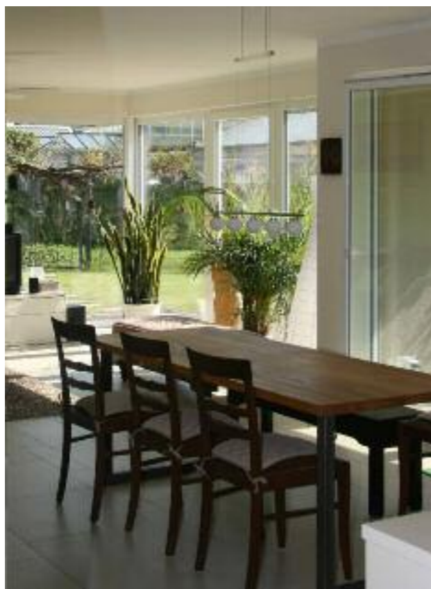
Gegen sommerliche Überhitzung helfen Beschattungssysteme sowie die Bauweise, denn die große Masse der Wände aus Kalksandstein speichern überschüssige Wärme.

Geräteraum, energieoptimierte Bauausführung mit Vollwärmeschutz, Brennwertgerät mit solarunterstützter Warmwasserbereitung, Fußbodenheizung, Fenster mit Dreifachverglasung und vieles mehr.