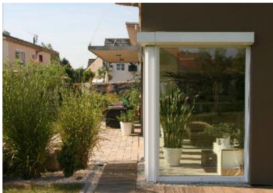
Braun ist sicherlich nicht die häufigste Fassadenfarbe, setzt aber nachvollziehbar hier angenehme Kontraste im Zusammenspiel mit dem in Weiß gehaltenen Obergeschoss.