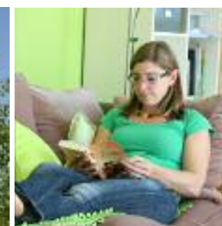
Ob im Haus oder auf der Terrasse – Möglichkeiten zum Entspannen und Lesen bietet das Haus eine ganze Reihe. Das eigene Zuhause als regenerierender Rückzugsbereich – perfekt!