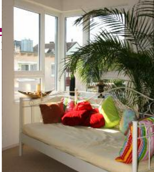
Den sprichwörtlichen Platz an der Sonne hat sich die Architektin hier geschaffen, eine Sofaecke, die fast schon mediterranes Flair vermittelt.

• Single-Glück • Single-Glück • Single-Glück • Single-Glück •