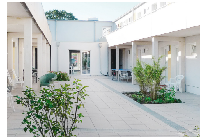
Einzelwohnungen wurden um den Innenhof gegliedert.

schutzes kostengünstig realisieren. Die Dicke der Dämmschicht wird dazu flexibel dem geforderten Wärmedämmniveau angepasst.