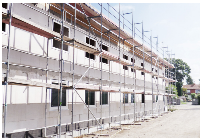
Verkürzung von Bauzeiten durch schnell wachsende Kalksandsteinwände.

Für Siebrecht ist eine funktionierende Arbeitsvorbereitung von unschätzbarem Wert. „Um unsere Bauvorhaben kostenoptimiert auf einem hohen Qualitätsstandard ausführen zu können, benötigen wir eine perfekte Verzahnung der Bauabläufe. Ein zügiger Bauablauf und der optimale Einsatz der Arbeitskräfte bestimmen maßgeblich den wirtschaftlichen Erfolg des Bauvorhabens.“ „Für uns ist die Baustelle eine Produktionsstätte, bei der alle Prozesse perfekt aufeinander abgestimmt sein