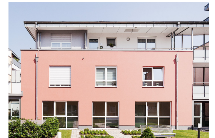
Ein klares Farbkonzept der WDVS-Fassaden strukturiert die facettenreiche Gestaltung der Wohnanlage.

Im Vergleich zu anderen Baumaterialien wird durch den Einsatz hochbelastbarer Kalksandsteine ein deutlicher Flächengewinn von bis zu sieben Prozent erzielt. Aufgrund der hohen Tragfähigkeit sind mit Kalksandstein schlanke Wandkonstruktionen möglich. Außenwände lassen sich bereits mit einer Dicke von 150 mm ausführen. Innenwände erfüllen die hohen statischen Anforderungen ab einer Dicke von nur 115 mm. Kalksandsteinwände sparen