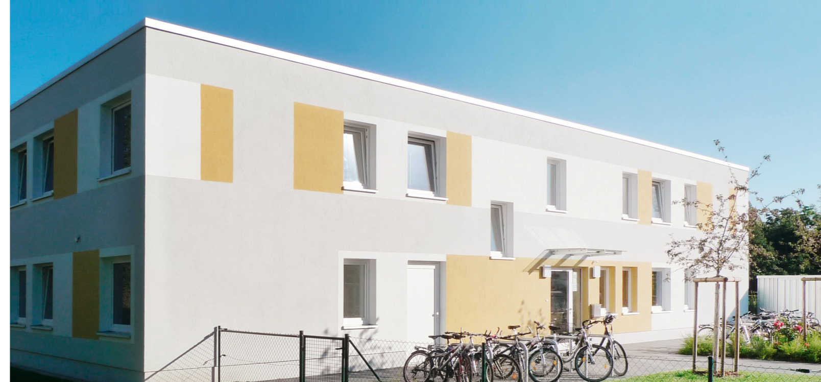
Zweigeschossige Unterkunft mit Nachnutzungsoption: Leichte Modifikationen ermöglichen dauerhaft nutzbaren Wohnraum.

Ein wesentlicher Schritt und eine notwendige Grundlage zum kostensparenden Bauen ist für Siebrecht die Bildung von Bauteams in einem möglichst sehr frühen Planungsstadium. „Für uns