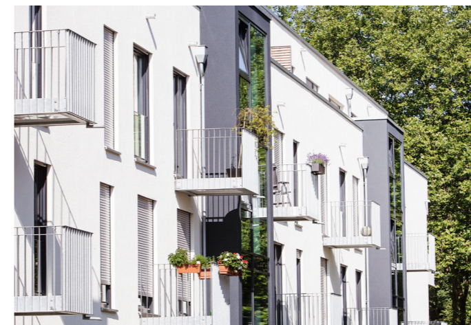
Bezahlbarer Wohnraum und architektonischer Anspruch im Einklang.

Kalksandstein ist ein zukunftsfähiger und zuverlässiger Baustoff. Beispielsweise beim Thema Energieeffizienz. Durch die Funktionstrennung Wand und Dämmung lassen sich Gebäude an jeden Energiestandard problemlos anpassen. Darüber hinaus vereint Kalksandstein die drei Dimensionen des Nachhaltigkeitsbegriffes Ökonomie, Ökologie und Soziales in sich. Der weiße Wandbaustoff besteht aus den rein natürlichen Rohstoffen Kalk, Sand und Wasser. Abbauflächen werden fachmännisch und mit großer Sorgfalt renaturiert. Weitere Vorteile des Kalksandsteins liegen in seiner hohen Ausführungsqualität und der bauphysikalischen Leistungsfähigkeit. Menschen, die sich mit Kalksandstein-